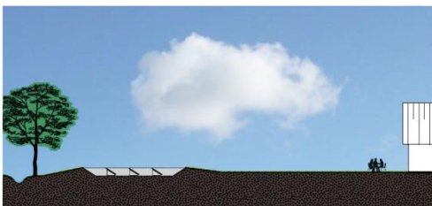
"Scherm zonnepanelen van de omgeving af door beplanting of taluds toe te passen"

De kwalitatieve criteria waarop het inpassingsplan / tuinplan door de gemeente zal worden beoordeeld zijn als volgt: