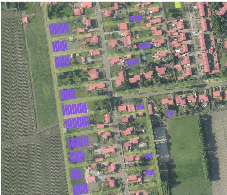
PRINCIPEVOORBEELD MAXIMAAL LAADVERMOGEN ACHTERTUINEN VOOR ZONNEPANELEN

0 20 40 m 1:2000 Rij. Ziel Gemeente Oldambt 23-8-2016